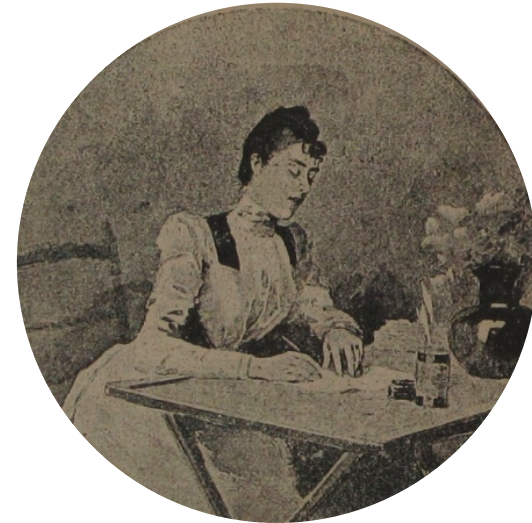
Kitaptan bir resim.

Mektuplaşmalardan oluşan eser yirmi dört sayfadır ve akıcı bir dille yazılmıştır. Hikâye, Adrian'ın Valentine'e mektubu ile başlar. Adrian on sekiz, Valentine ise on dokuz yaşında evli bir kadındır. Bu mektup gündelik hayat, baba-kız ilişkisi, evlilik konusundaki düşüncelerden oluşmaktadır. Ancak mektuptaki asıl olay Adrian'ın halasının oğlu, asker olan Rene ile varlıklı Kazimir (Mösyö Vilong) arasındaki hangisi ile izdivaç yapılacağı meselesidir.