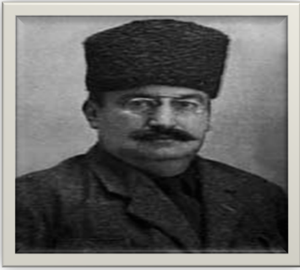
YUNUS NADİ ABALIOĞLU (1879-1945)

Bu çalışmada Yunus Nadi'nin hayatı ve eserleri hakkında bilgi verilmiştir. Daha sonra Malumat dergisinde yayımladığı çevirilerden biri olan Fransız aşk hikâyesi Artemiz adlı hikâyesinin öncelikle geniş bir özeti daha sonrasında da metnin Latin harflerine aktarılmış biçimi verilmiştir.